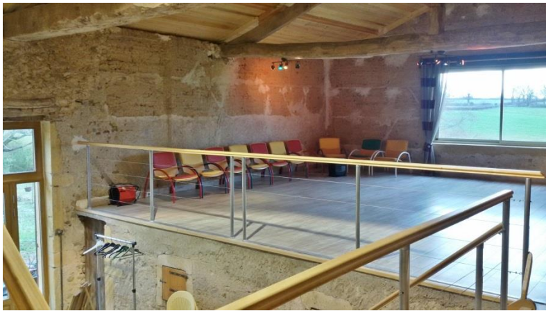
La vaste salle très lumineuse, réservée aux activités.