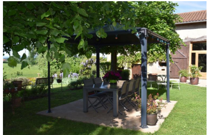
La pergola pour la joie d'expérimenter en extérieur et partager les repas.