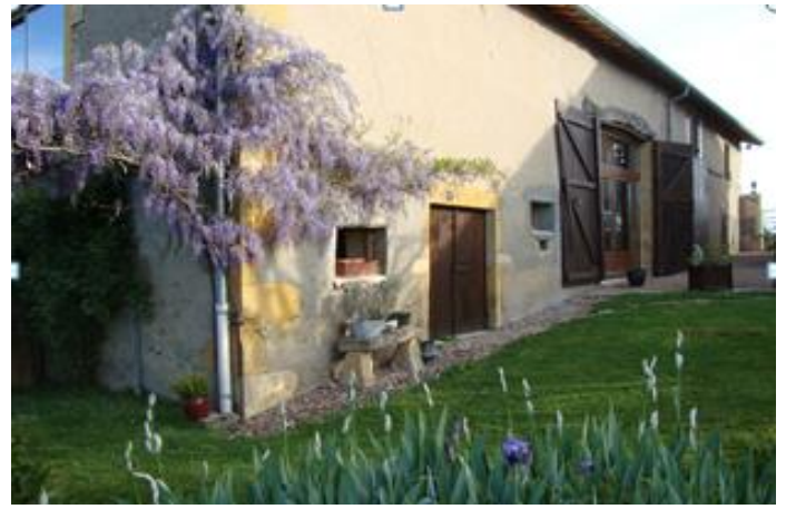
La Maison du Temps pour Soi