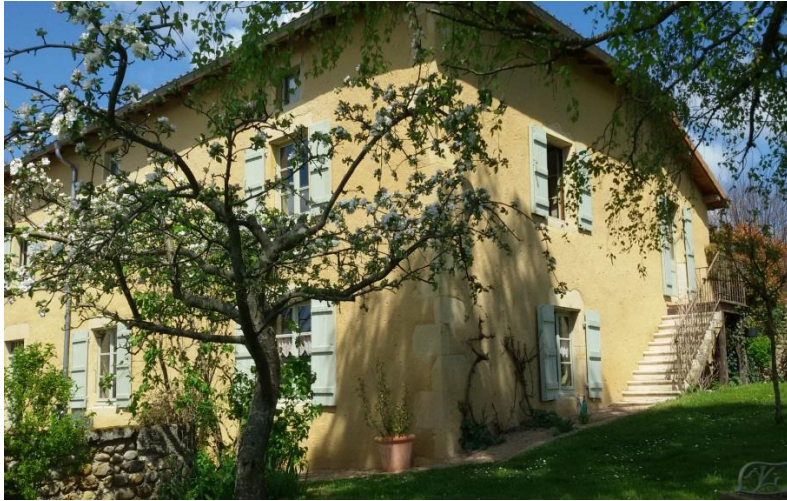
Une maison d'hôtes pleine de charme