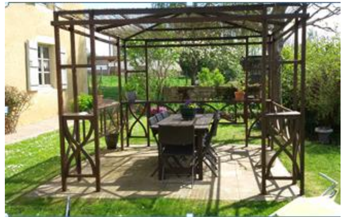
La pergola pour la joie d'expérimenter en extérieur et partager les repas.