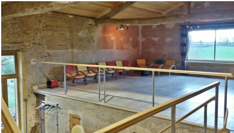
La vaste salle très lumineuse, réservée aux activités.